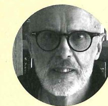
Hjerneforsker. Kenneth Hugdahl

I en spørreundersøkelse gjennomført av forskere ved NTNU, St. Olavs hospital og Universitetet i Bergen fremkom det at cirka 7,5 prosent av befolkningen rapporterte at de regelmessig hører stemmer i form av hallusinasjoner.